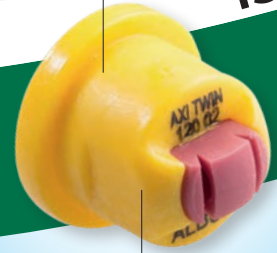
Code couleur ISO