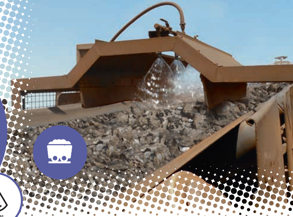
TABLEAU DE DÉBIT